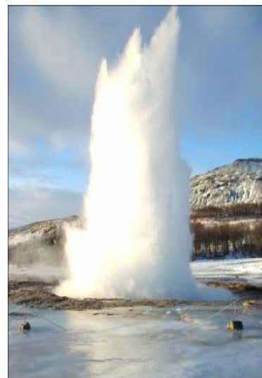
THINGVELLIR NEMZETI PARK

PARK-ban, ahol egykor az országgyűléseket is tartották.