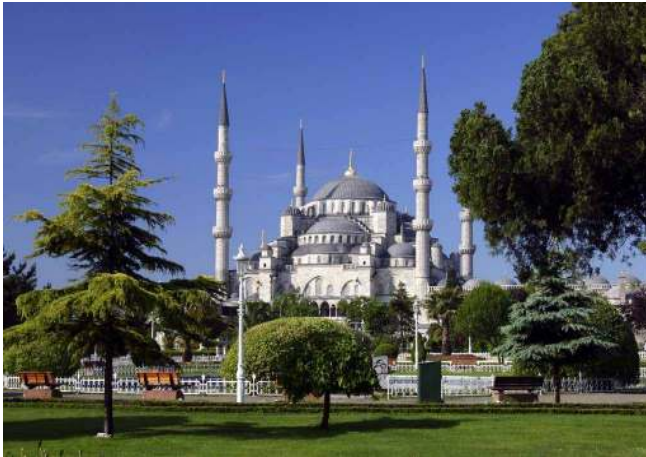
ISZTAMBUL: KÉK MECSET

ISZTAMBUL több mint 14 milliós lakosságával Törökország legnagyobb városa, annak kulturális, művészeti és gazdasági központja. Délelőtt városnézés a Török Birodalom egykori fővárosában: Kék mecset, Aya Sophia, Topkapi Palota stb. Délután szabadidő. Vacsora, szállás.